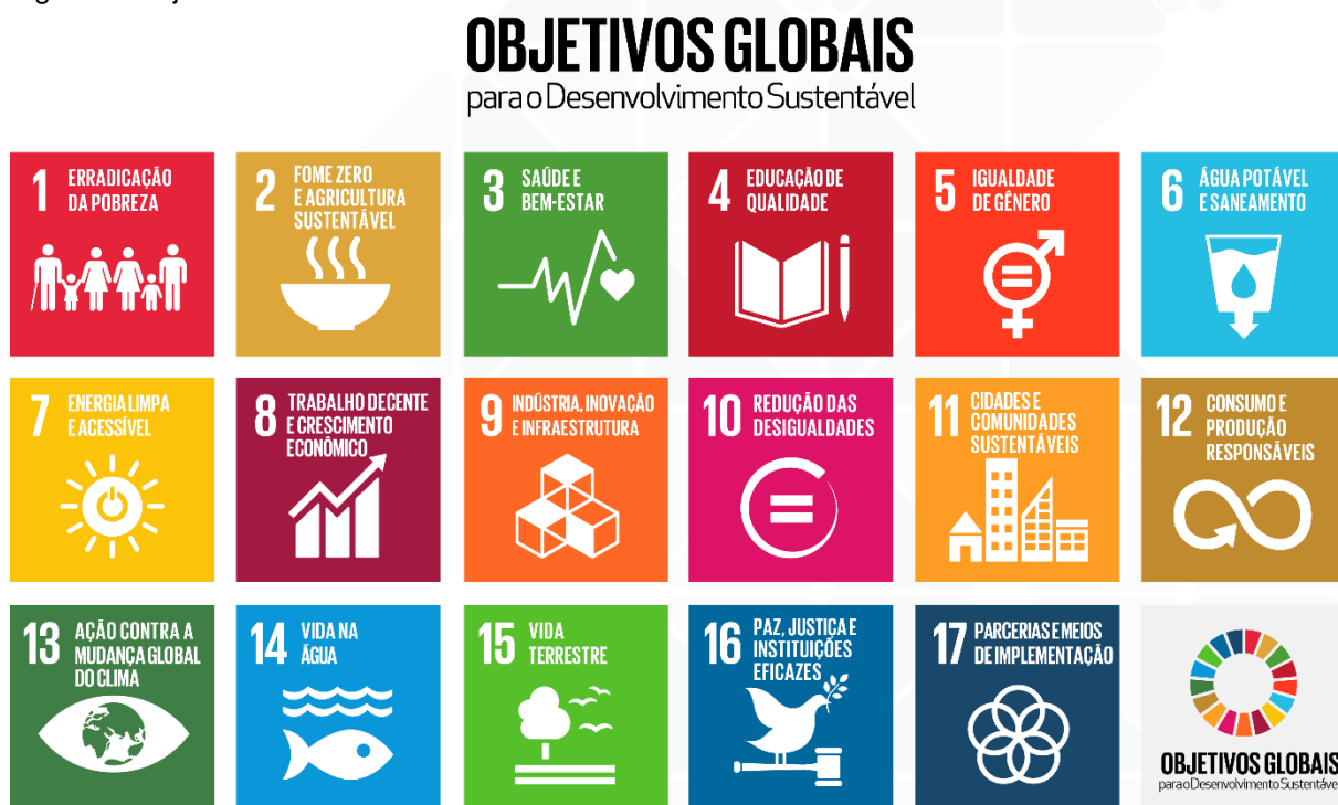
Figura 1: Objetivos de desenvolvimento sustentável

Os 193 países-membros das Nações Unidas adotaram oficialmente a nova agenda de desenvolvimento sustentável, intitulada “Transformando nosso mundo: A agenda 2030 para o desenvolvimento sustentável”, na cúpula de desenvolvimento sustentável, realizada na sede da ONU em Nova York, em setembro de 2015. Essa agenda contém 17 objetivos e 169 metas (Figura 1):