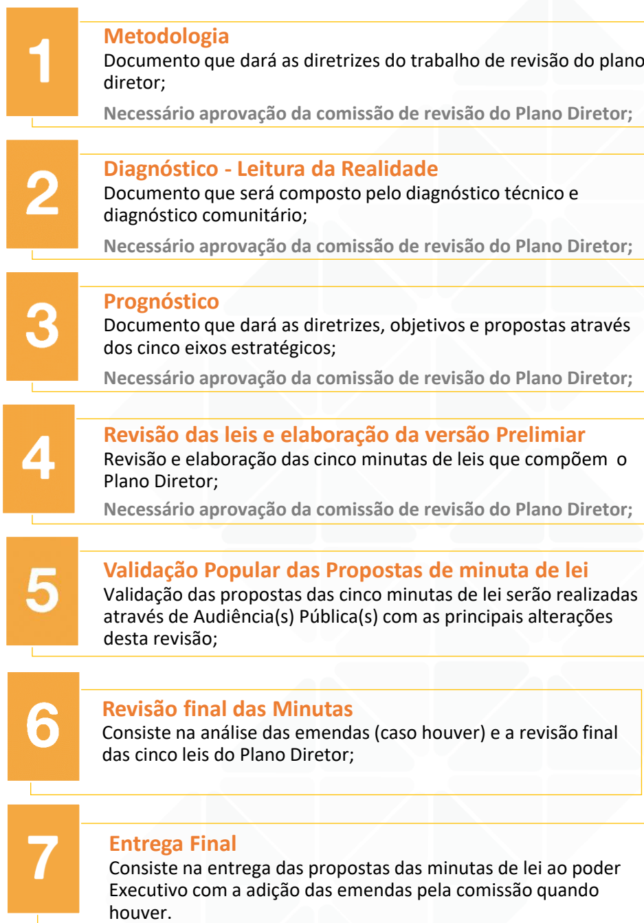
Figura 2: Proposta de Revisão do Plano Diretor de Lacerdópolis